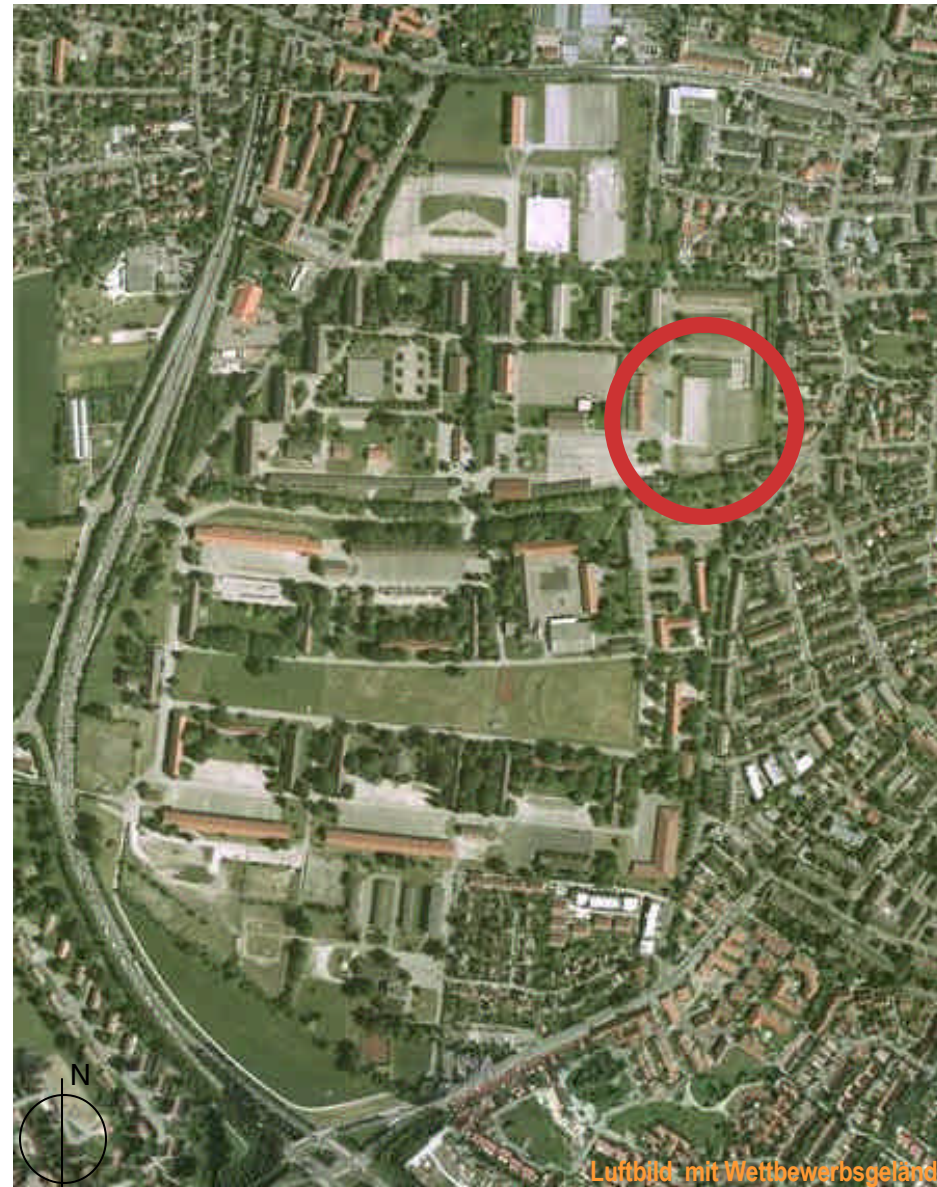
Luftbild mit Wettbewerbsgelände

Der Zulassungsbereich umfasste die EWR-Staaten und Staaten der Vertragsparteien des WTO-Übereinkommens über das öffentliche Beschaffungswesen (GPA).